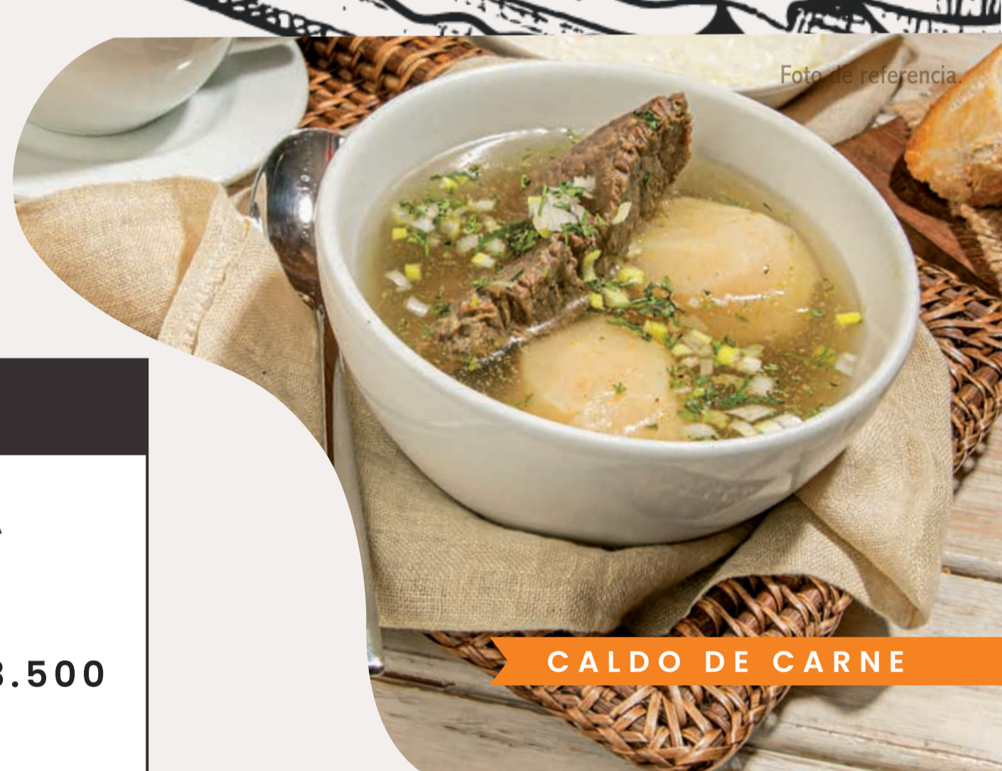
CALDO DE CARNE

* Guanábana, Maracuyá, Mango, Mora o Naranja.